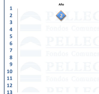
Posiciones - Pellegrini