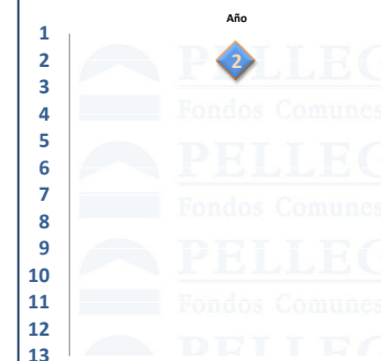
Posiciones - Pellegrini