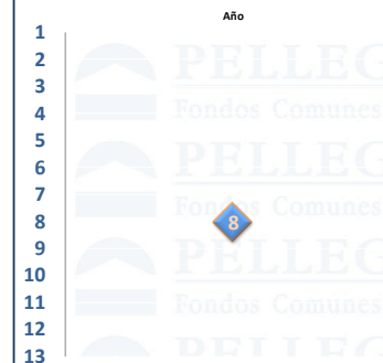
Posiciones - Pellegrini